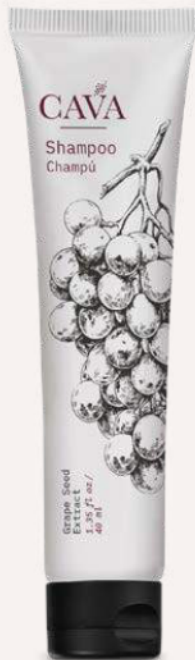
Shampoo 40ml Cod. 4052-L17 Caja con 150pzas.