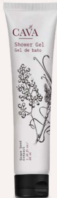
Gel de baño 40ml Cod. 4052-L19 Caja con 150pzas.