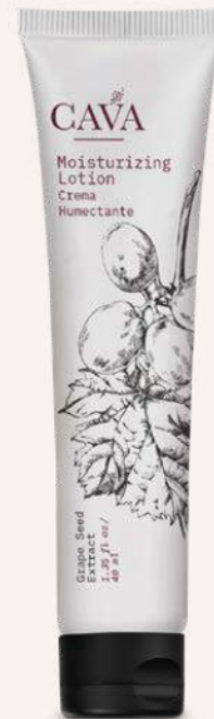
Crema humectante 40ml Cod. 4052-L20 Caja con 150pzas.

nOcean™ Tubos envasados con plástico nOcean.