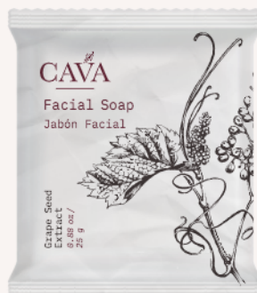
Jabón facial 25g Cod. 4052-I03 Caja con 300pzas.

nOcean™ Tubos envasados con plástico nOcean.