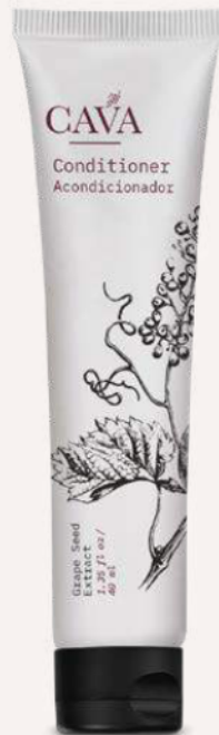
Acondicionador 40ml Cod. 4052-L18 Caja con 150pzas.