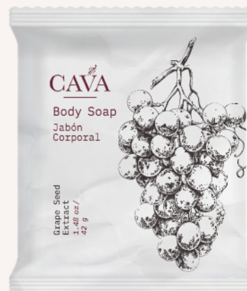
Jabón corporal 42g Cod. 4052-I04 Caja con 300pzas.